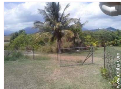
vista sobre el campo