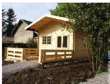
Cabaña Bungalow con Encanto