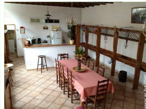
cuarto de estar