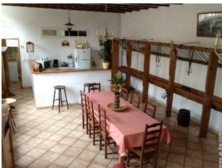
cuarto de estar