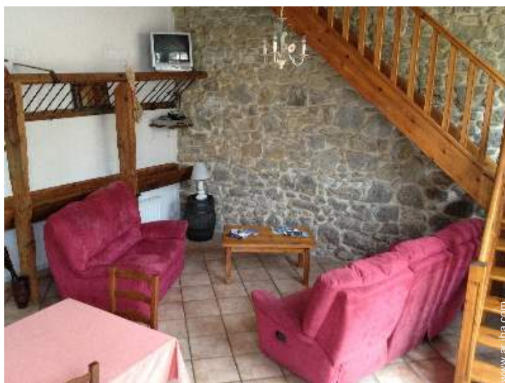
cuarto de estar