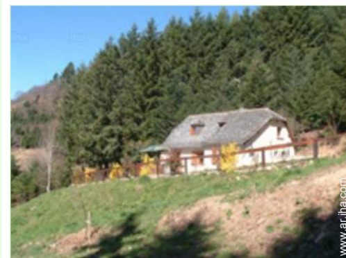
vista de conjunto

Centro del pueblo 4km Panadería 4km Catering 4km Pequeños comercios 4km Correos 4km Cajero automático 4km Farmacia 4km Doctor 4km Enfermera 4km