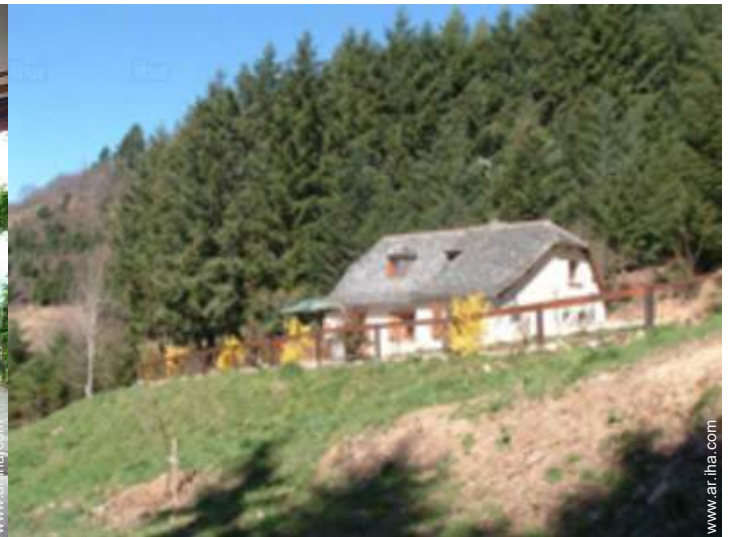
vista de conjunto