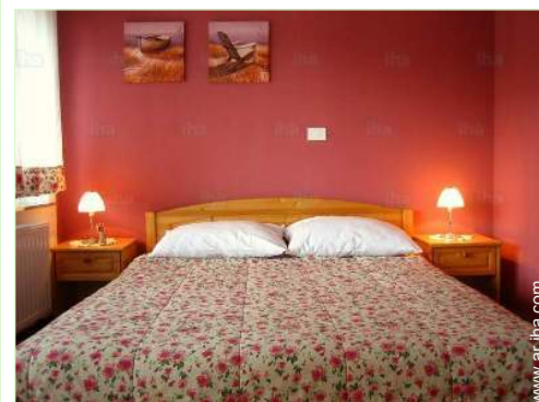
cama de matrimonio