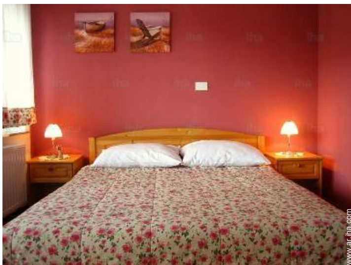
cama de matrimonio