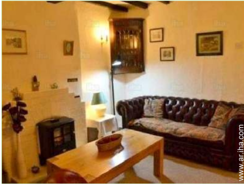
habitación de servicio