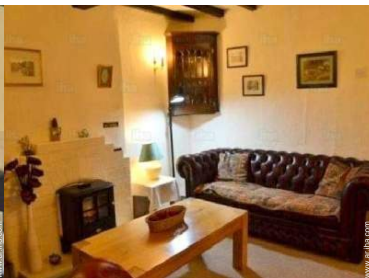
habitación de servicio