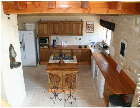
gran cocina americana