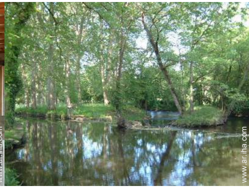
vista sobre el río