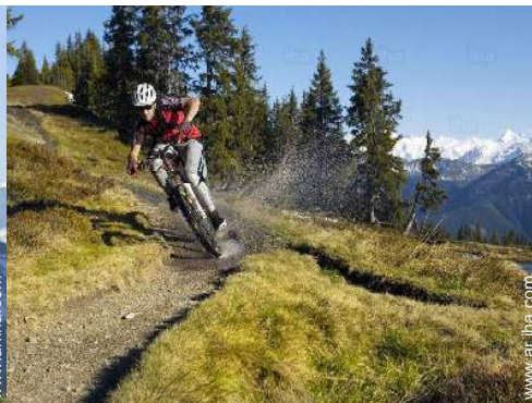
actividades de ocio de verano cercanas