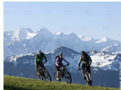
MTB (itinerario circuito)

Parrilla, mesa(s) de jardín, silla(s) de jardín, sombrilla, área de jardín, 4 tumbona(s), balancín