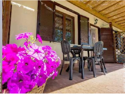
vista desde la veranda