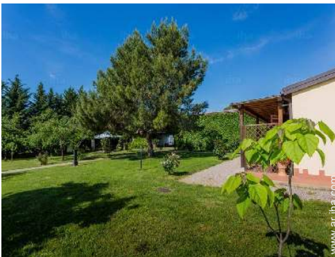
vista sobre el jardín/parque