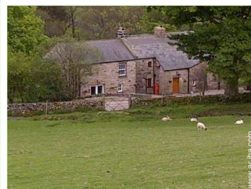
vista sobre campos agrícolas

Centro del pueblo 5km El centro 10km Alquiler de bici/MTB 10km Panadería 10km Pequeños comercios 10km Supermercado 10km Peluquería 10km Correos 10km Banco 10km Cajero automático 10km Farmacia 10km Doctor 10km Hospital 30km Dispensario 10km