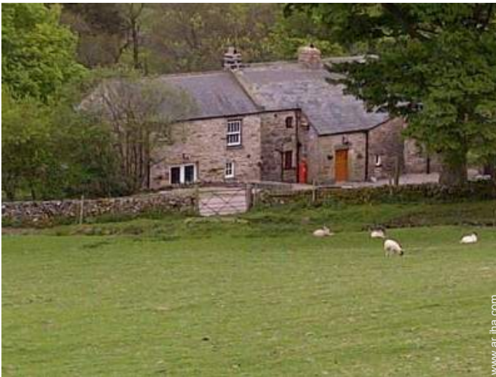
vista sobre campos agrícolas