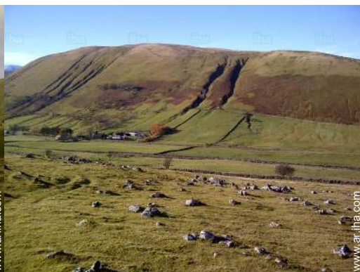
vista sobre el campo