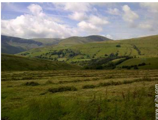
vista sobre el campo