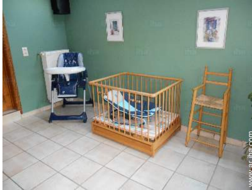
instalaciones de bebé