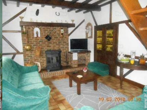
sala de televisión