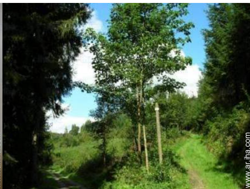
actividades de ocio cercanas