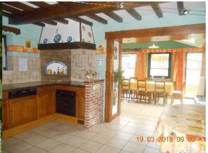
área de cocina