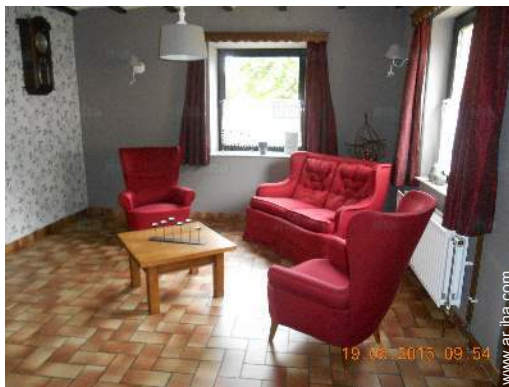
sala de biblioteca