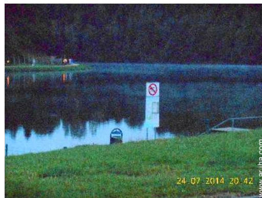
actividades balnearias cercanas