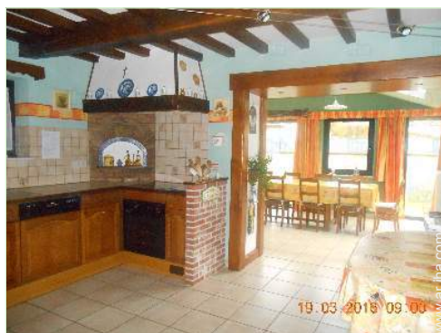
área de cocina

Vajilla/cubiertos, utensilios de cocina, cafetera, cafetera eléctrica, cafetera express, hervidor eléctrico, tostador, exprimidor, máquina de crepes, aparato de la raclette, aparato de la fondue, cocina eléctrica, placa eléctrica, horno, microondas, campana extractora, nevera, congelador, lavavajilla, lavadora, aspirador, plancha, tabla de planchar