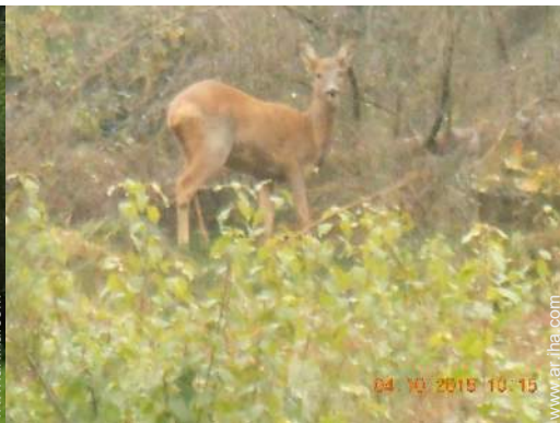
vista desde el jardín/parque