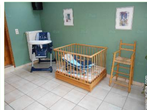
instalaciones de bebé

Parrilla, mesa(s) de jardín, 8 silla(s) de jardín, sombrilla, 3 tumbona(s), columpio, columpio