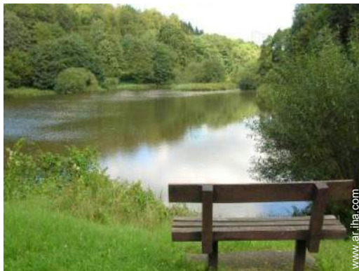
actividades de ocio cercanas