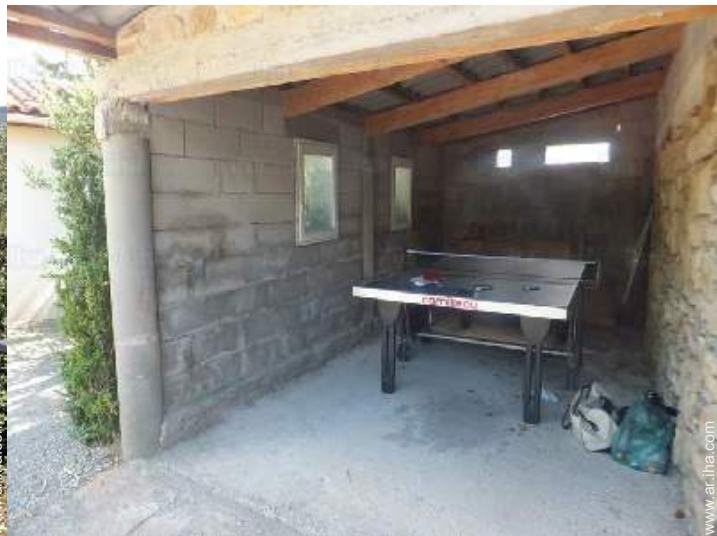
mesa de ping-pong