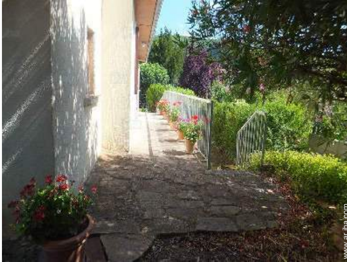
terreno de petanca