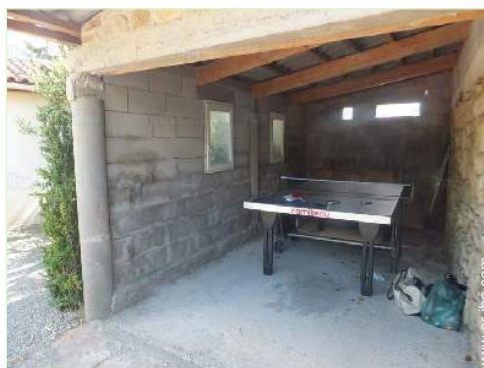
mesa de ping-pong