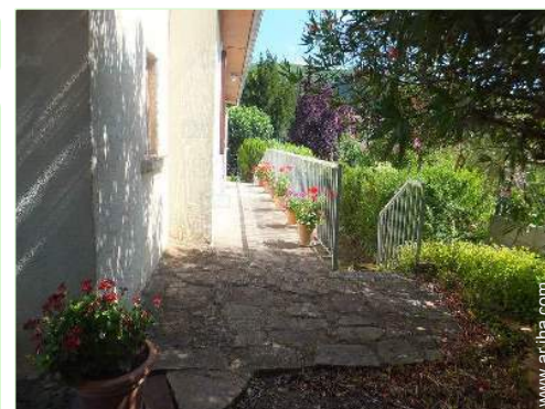
terreno de petanca

Parrilla, mesa(s) de jardín, 6 silla(s) de jardín, 2 reposera(s), columpio