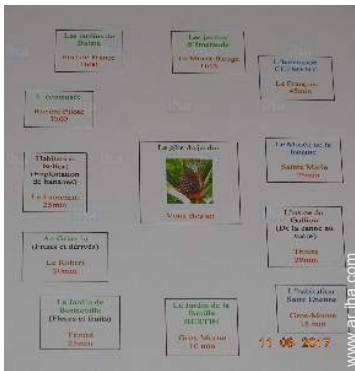
parque y jardín