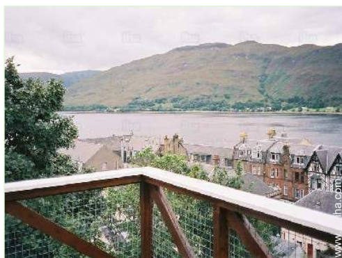
vista desde el balcón