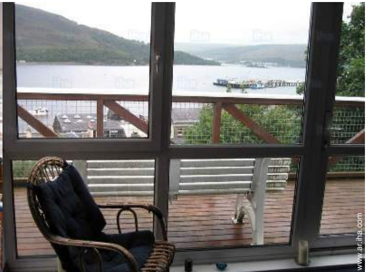
vista desde el salón