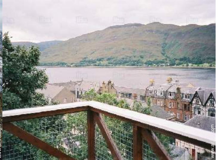
vista desde el balcón