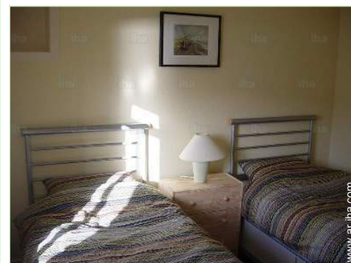
camas gemelas sencilla