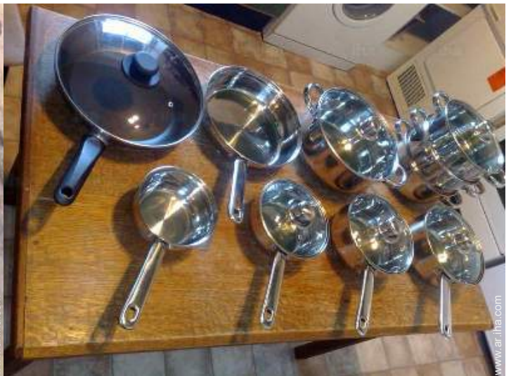
Instalaciones a disposición