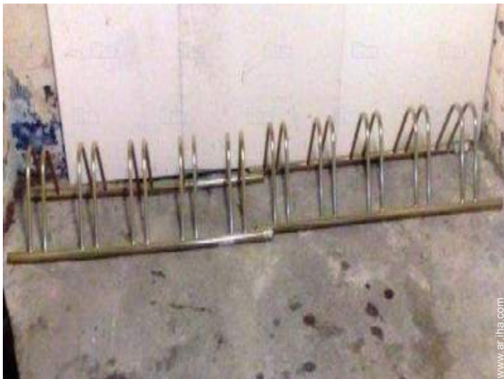
Instalaciones a disposición