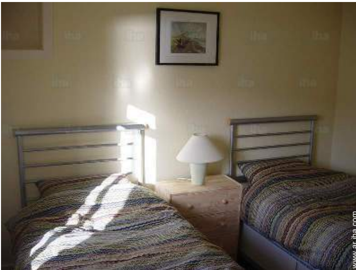
camas gemelas sencilla