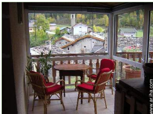
vista desde la veranda