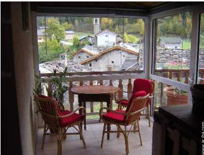
vista desde la veranda