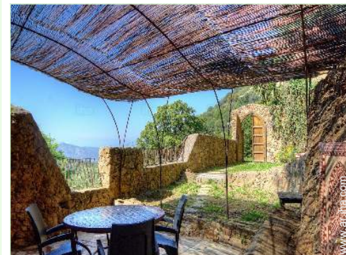
vista desde el apartamento