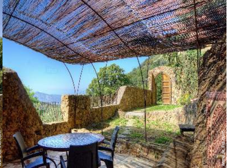
vista desde el apartamento