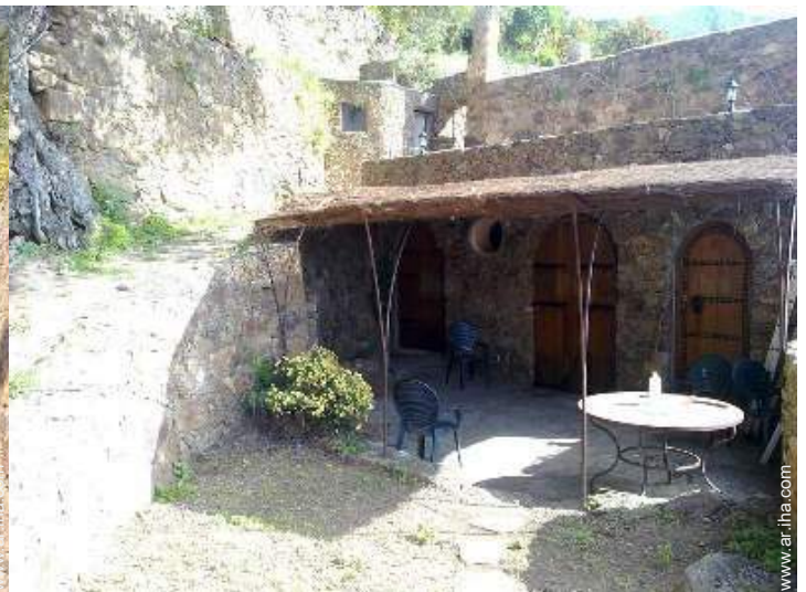
Casa de Piedra