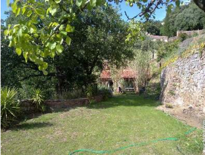
vista desde el jardin/parque