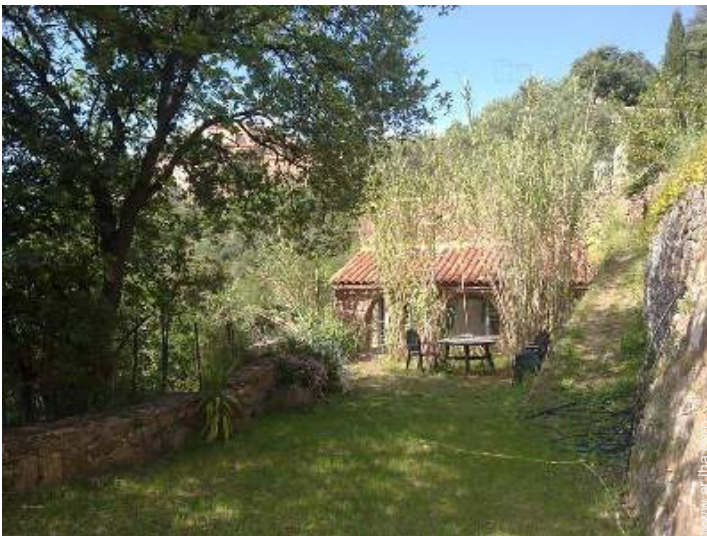
vista desde el jardin/parque