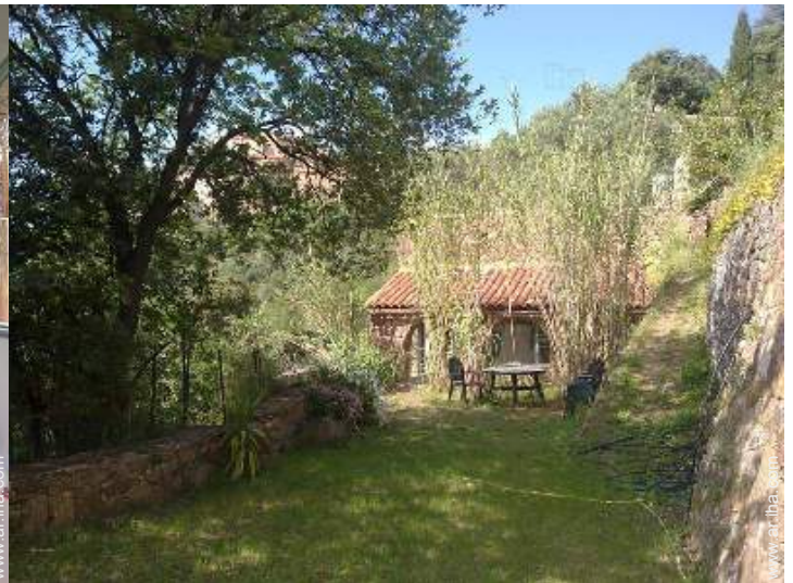
vista desde el jardin/parque