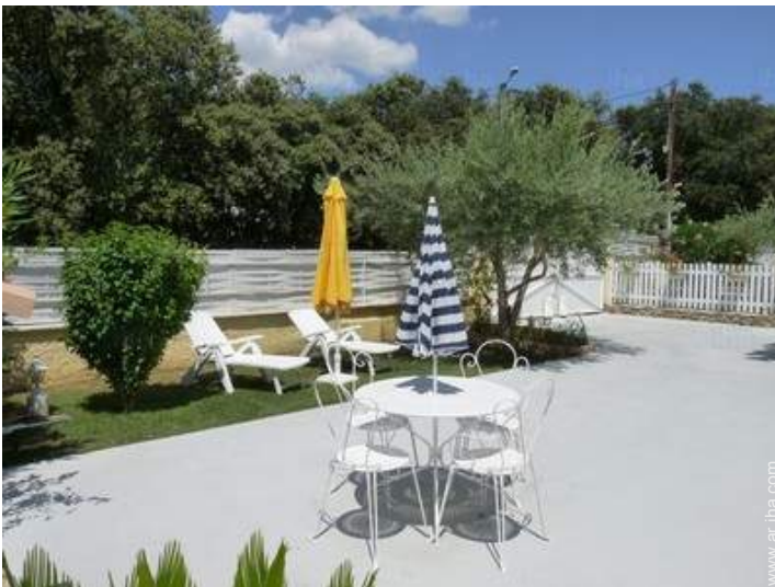
vista sobre el patio