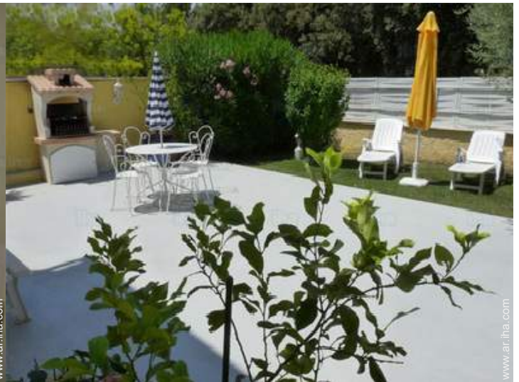
vista sobre el patio