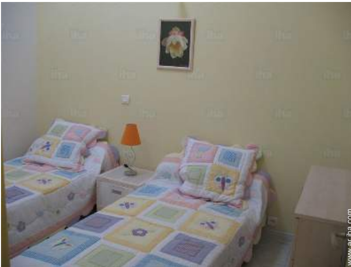
camas gemelas sencilla