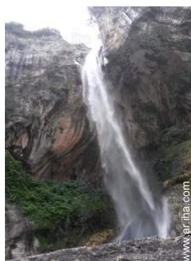
actividades de ocio cercanas