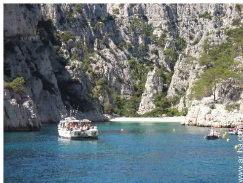
actividades de ocio de verano cercanas