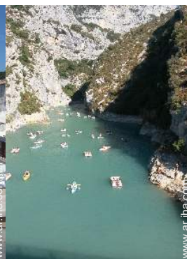
actividades de ocio cercanas