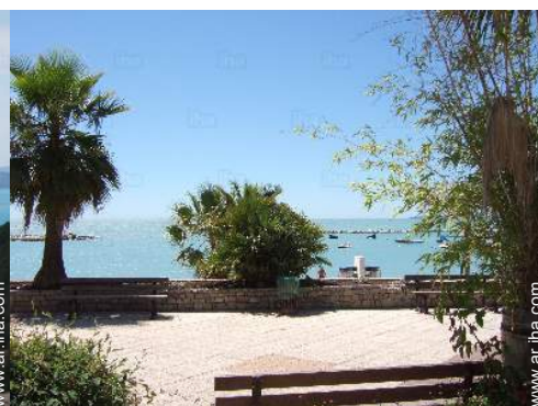
actividades de ocio de verano cercanas