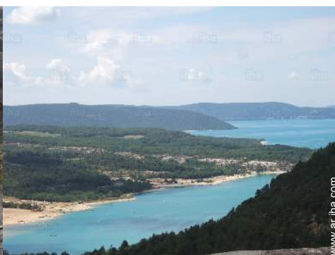
actividades de ocio cercanas