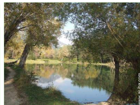
actividades de ocio cercanas