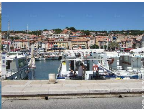
actividades de ocio de verano cercanas