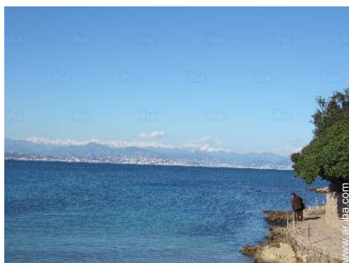
actividades de ocio cercanas