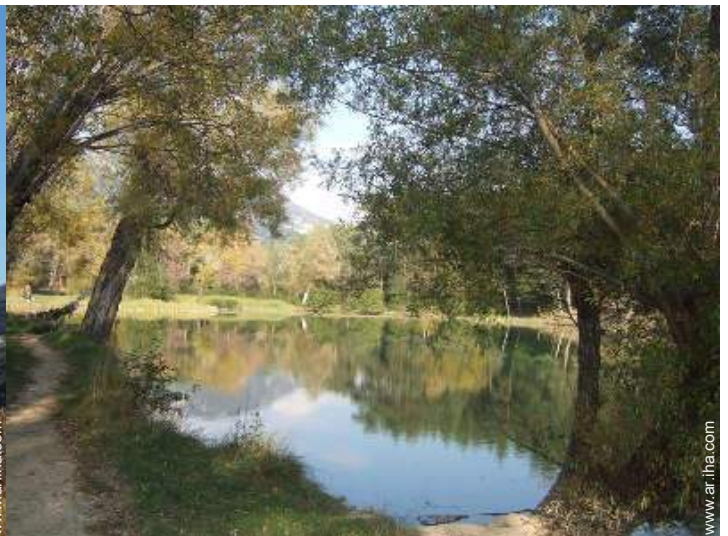
actividades de ocio cercanas