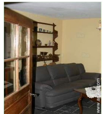
sala de televisión

Pistas de esquí 15km Pista de tenis pública 3km Bosque 500m