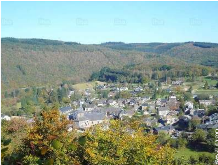
centro del pueblo