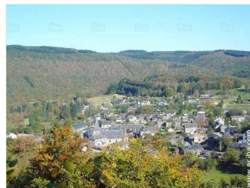
centro del pueblo