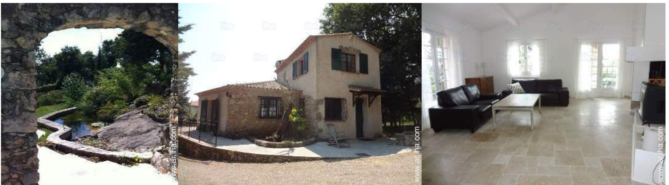
Disposición interior privado