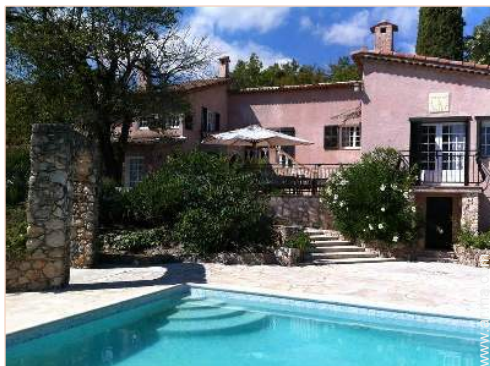
Casa Provençal con Encanto