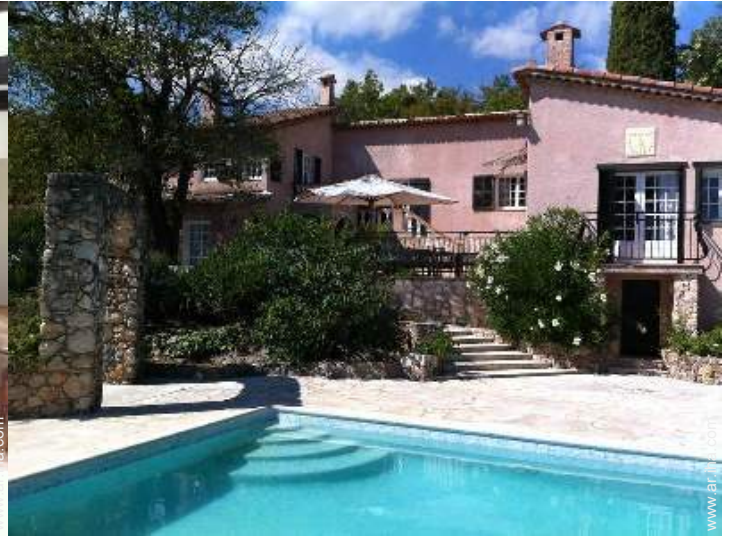
Casa Provenzal con Encanto