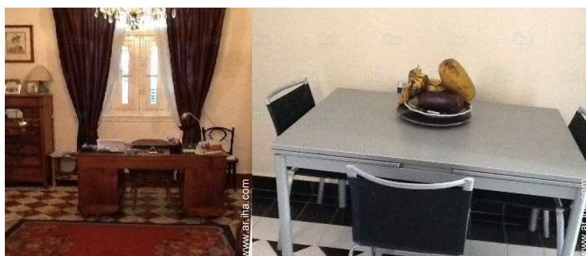
sala de biblioteca