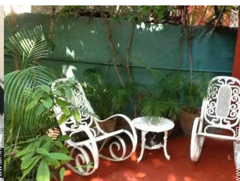
área de descanso