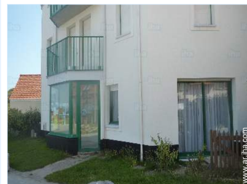
acceso directo playa