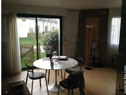
acceso directo playa