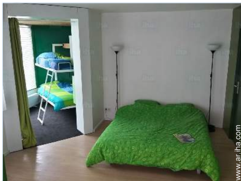
vista desde la cocina