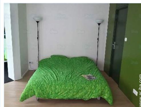
sofá cama 2 pers

Centro del pueblo 50m El centro 50m Parada/estación de guagua 200m Panadería 50m Pequeños comercios 50m Supermercado Peluquería 100m Correos 50m Cajero automático 100m Farmacia Doctor Enfermera Hospital