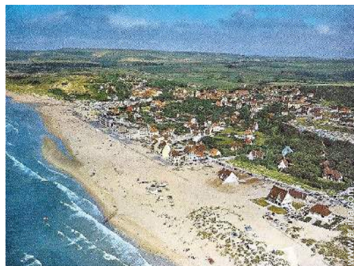
vista de conjunto