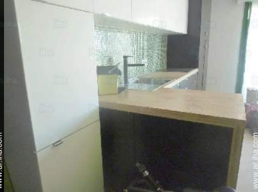
área de cocina