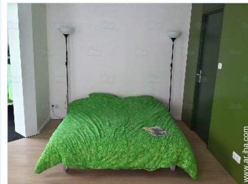
sofá cama 2 pers

Mar/océano Playa de arena <50m Piscina pública 15km Pista de tenis pública 3km Recorrido de golf 9 hoyos 7,5km Anuncio de windsurf Base náutica <50m Acantilado 7,5km Estanque 10km Bosque 5km Puerto deportivo 15km