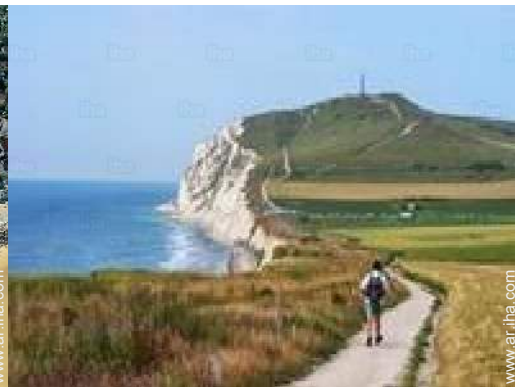
actividades de ocio cercanas