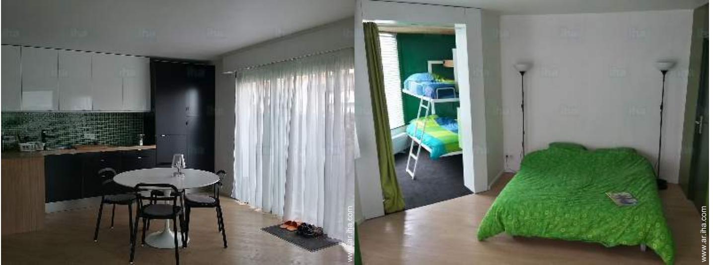
vista desde la cocina