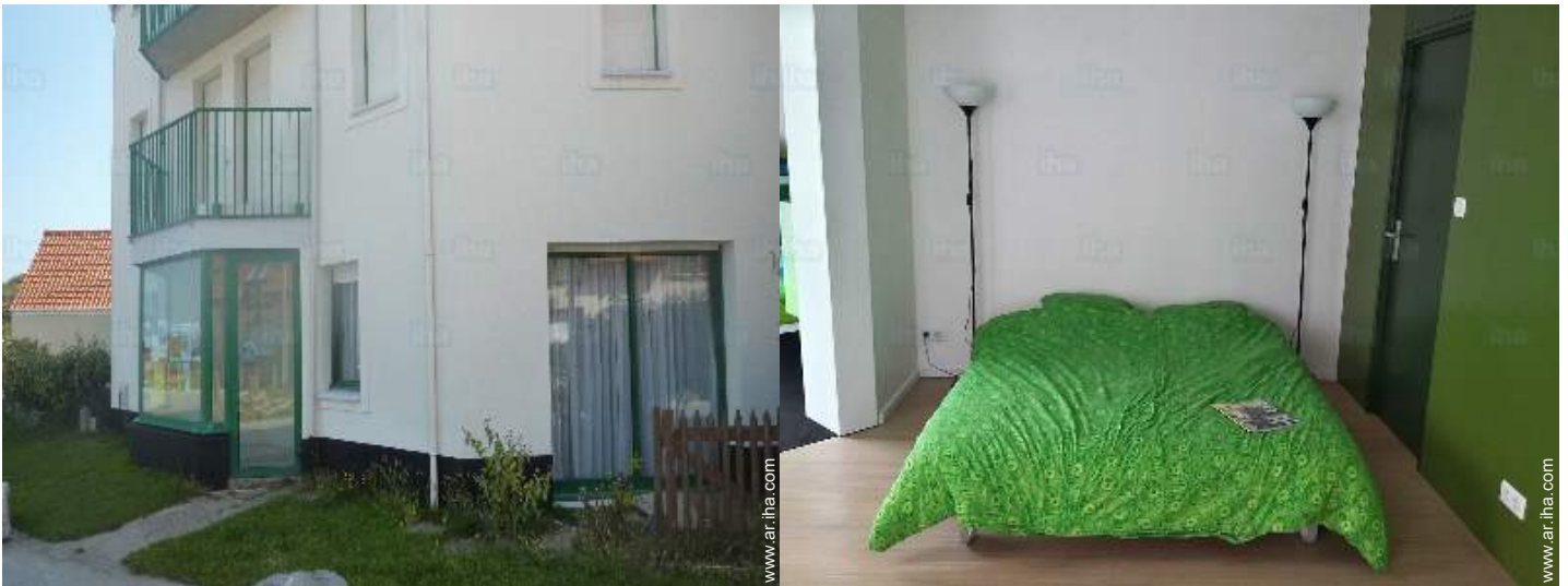
acceso directo playa