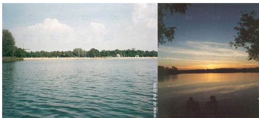
playa de arena