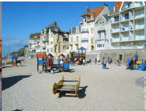
Zonas atractivas y relajación