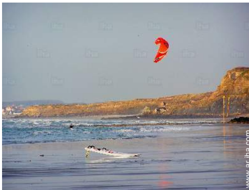
anuncio de windsurf