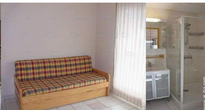
sofá cama 2 pers