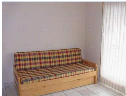
sofá cama 2 pers