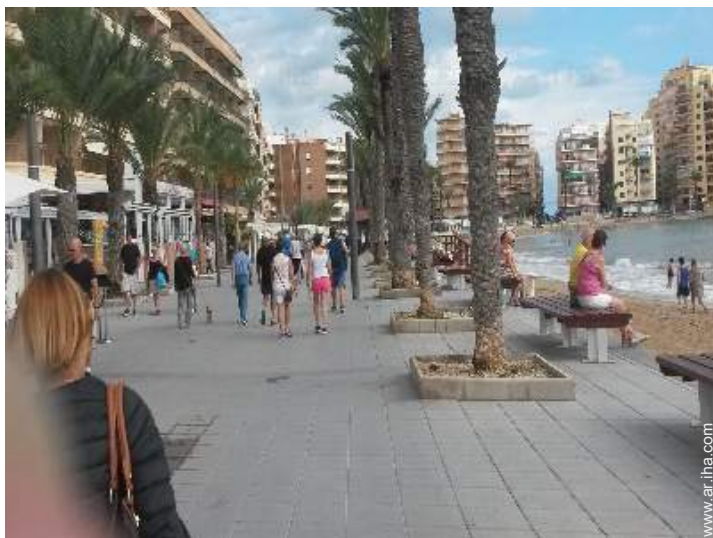
camino para pasear