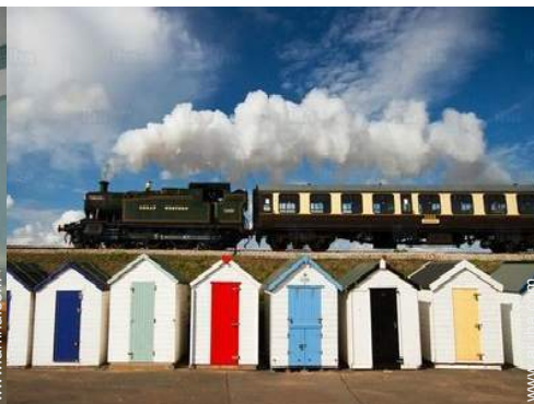
Zonas atractivas y relajación