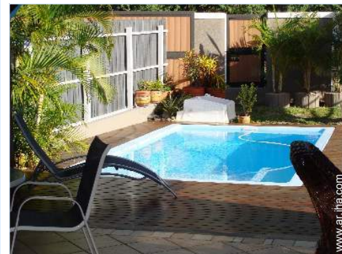
vista desde le comedor