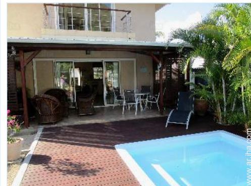
vista desde la piscina