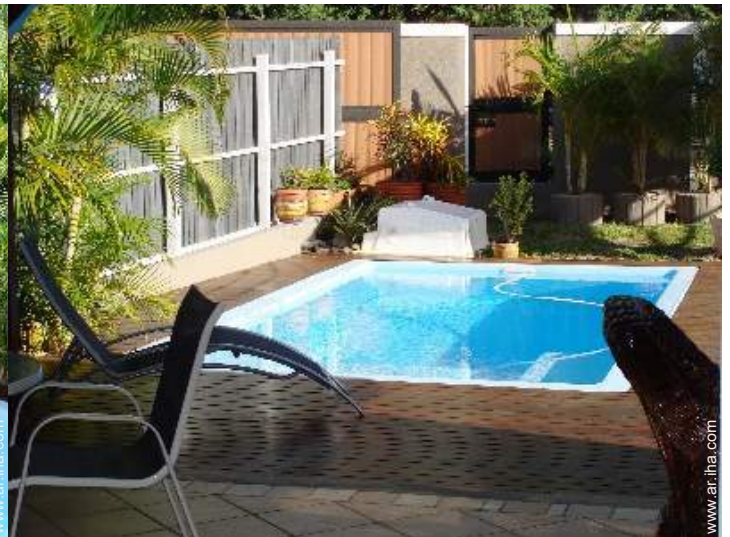
vista desde le comedor