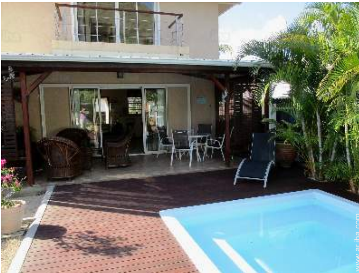
vista desde la piscina