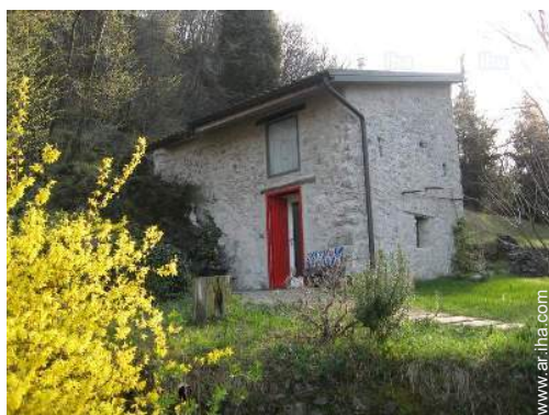
Casa de Piedra