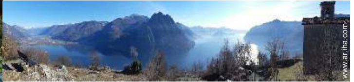
vista sobre el lago