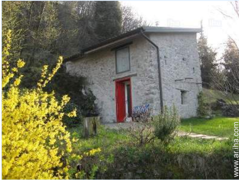
Casa de Piedra