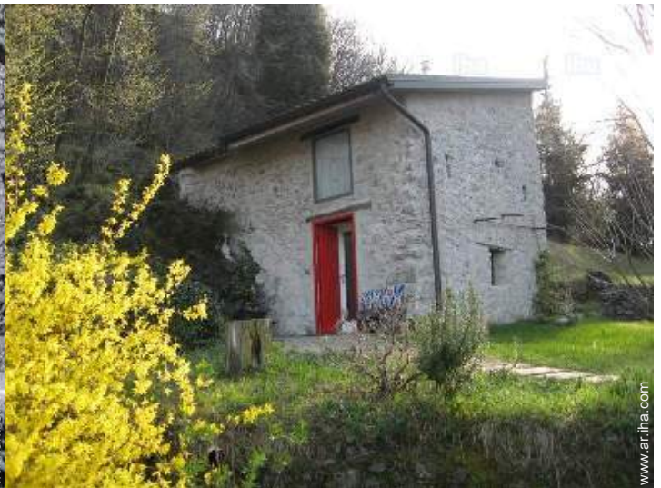
Casa de Piedra