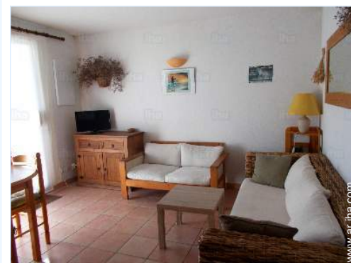
sala de televisión