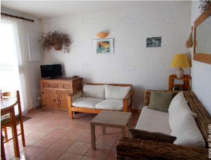
sala de televisión