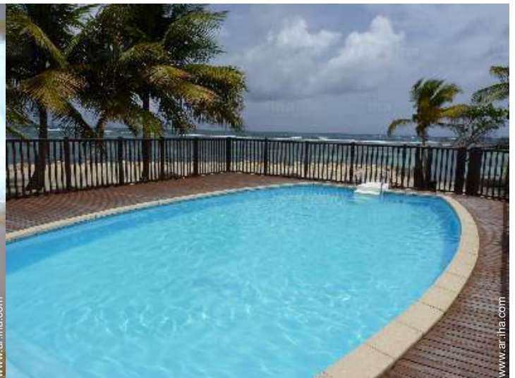
piscina en la residencia