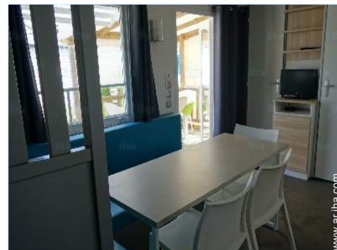
Confort interior e instalaciones