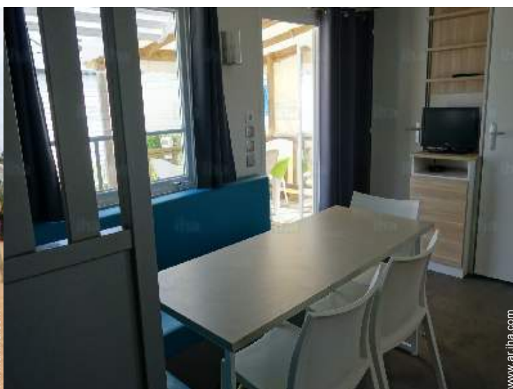
Confort interior e instalaciones