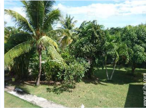
vista sobre el jardín/parque

Salón de té, parrilla, mesa(s) de jardín, silla (s) de jardín, sombrilla, 4 tumbona(s), ducha exterior