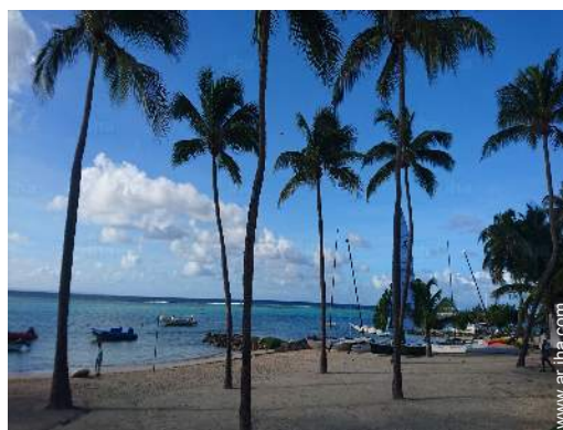
actividades náuticas cercanas