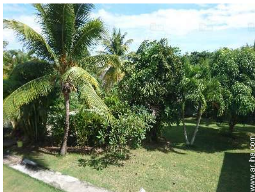
vista sobre el jardin/parque