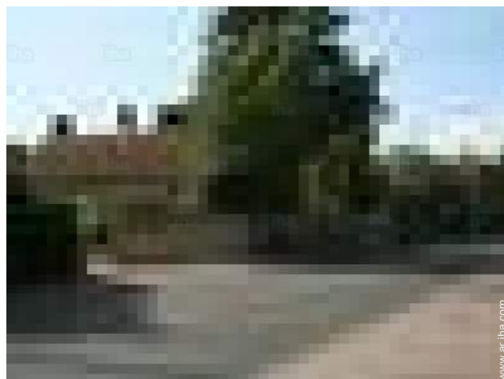
vista sobre la calle/la avenida