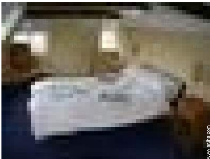
cuarto de invitados