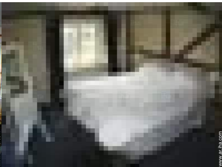
cuarto de invitados