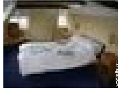
cuarto de invitados