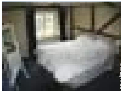
cuarto de invitados