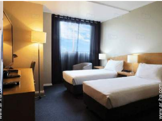
posibilidad cama(s) suplementaria(s)