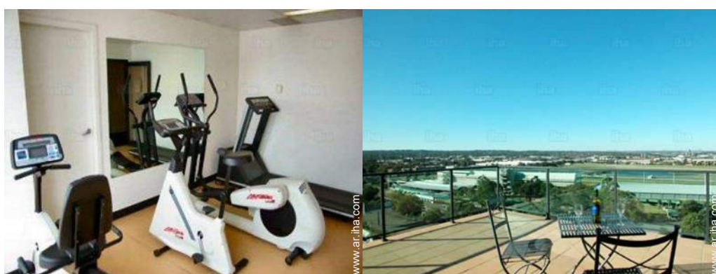
máquina(s) de musculación