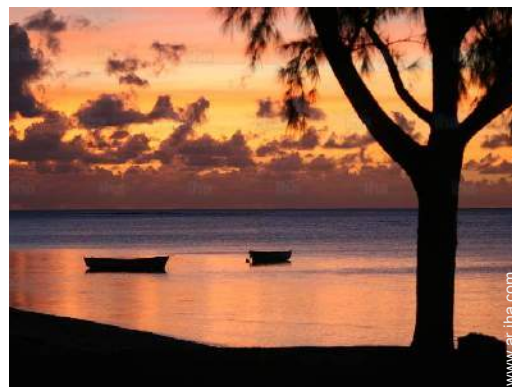
vista sobre la puesta del sol