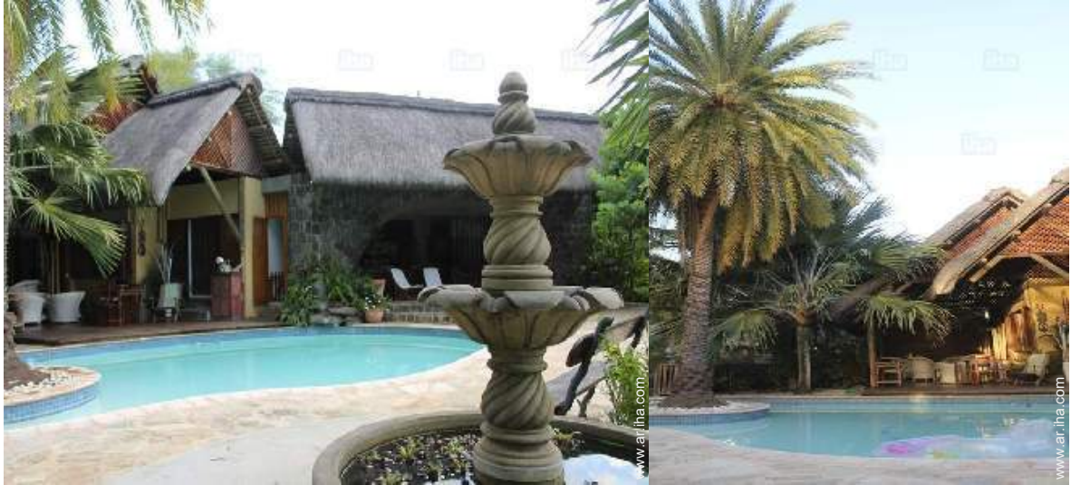
vista sobre la piscina