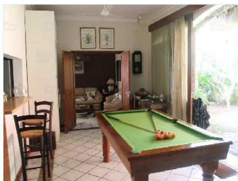
mesa de billar