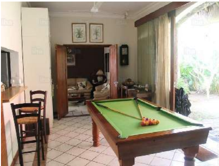
mesa de billar