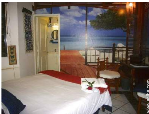
cuarto de invitados