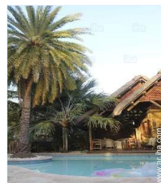
vista sobre la piscina