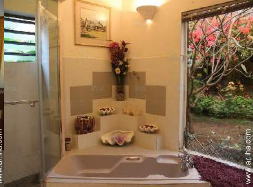
cuarto de baño