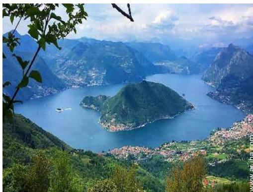
vista sobre el lago