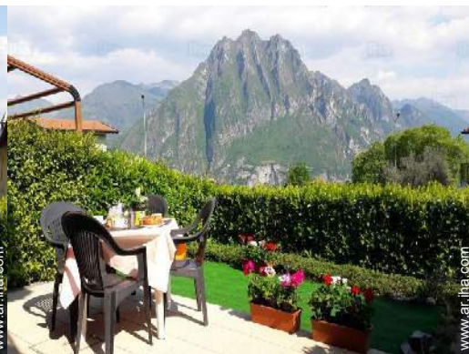
vista sobre el patio