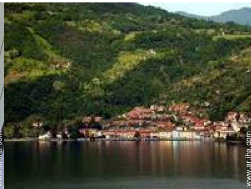
vista sobre el lago