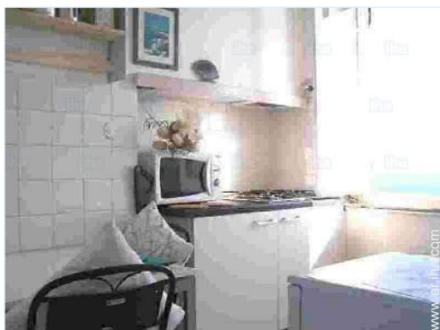
vista desde la cocina