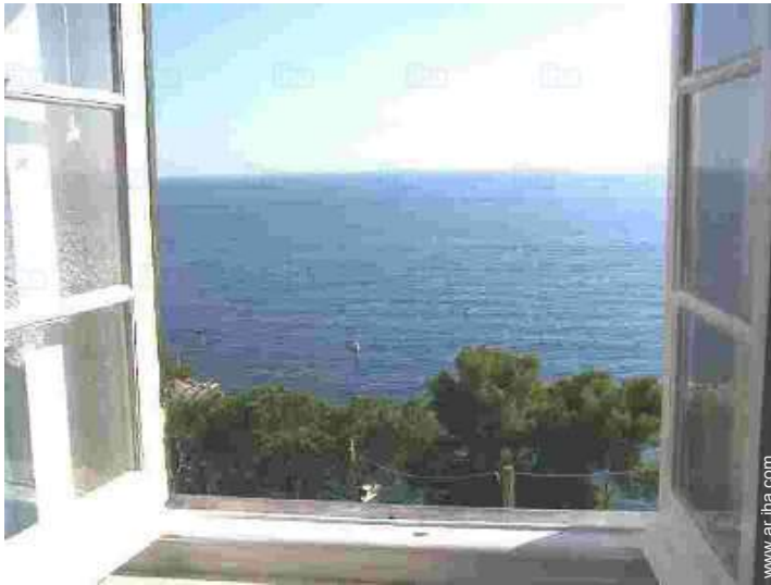
vista desde el apartamento