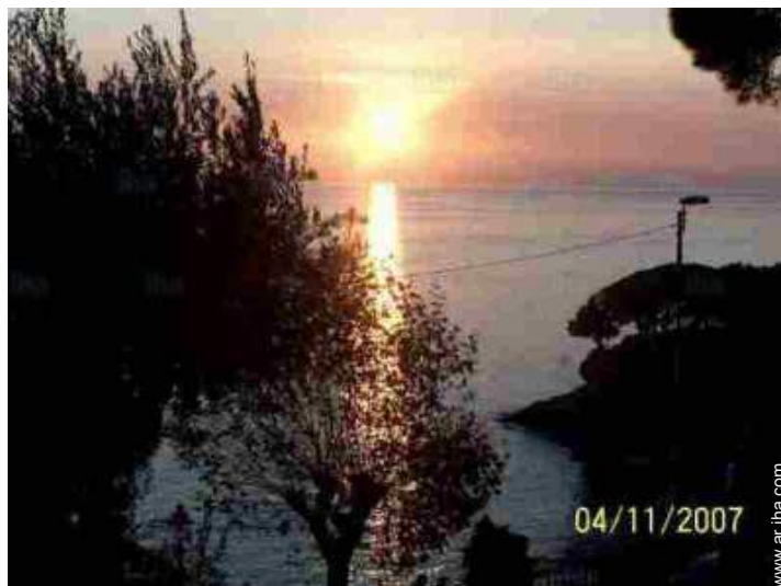
vista sobre la apuesta del sol