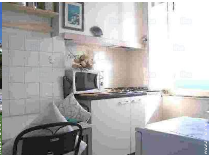
vista desde la cocina