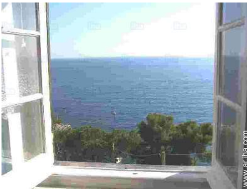
vista desde el apartamento