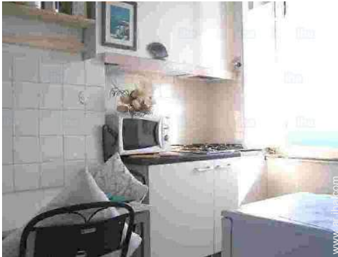
vista desde la cocina