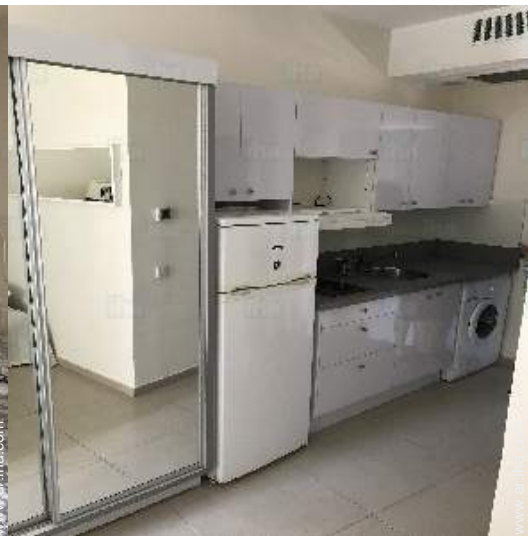
área de cocina