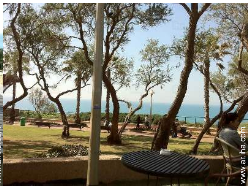
parque y jardin