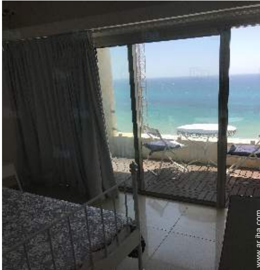
vista desde el dormitorio