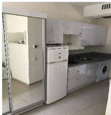
área de cocina