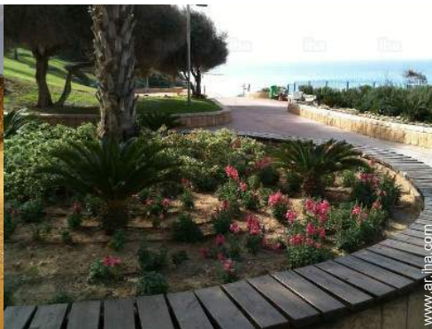
actividades de ocio cercanas