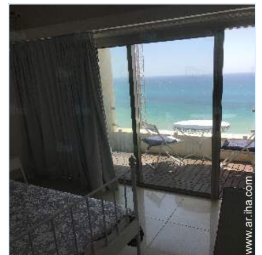
vista desde el dormitorio