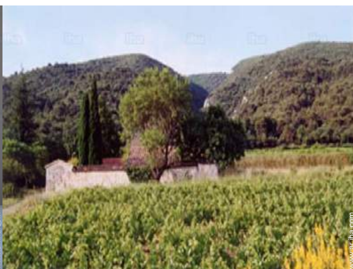
vista desde la casa