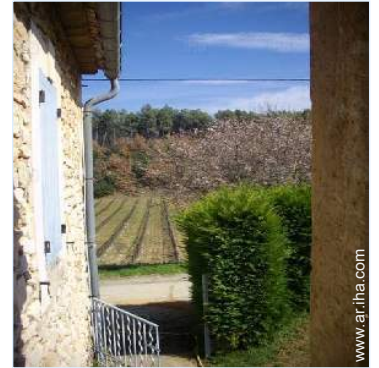
vista sobre viñedos

Parrilla, mesa(s) de jardín, 6 silla(s) de jardín, sombrilla, 2 reposera(s)