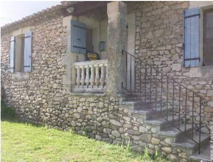
Casa de Piedra