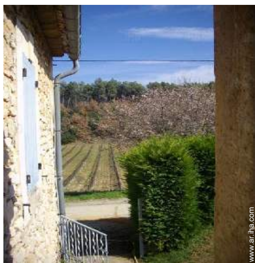
vista sobre viñedos