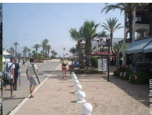
actividades náuticas cercanas