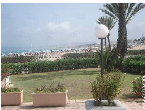
actividades náuticas cercanas