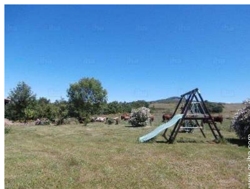
instalación de ocios