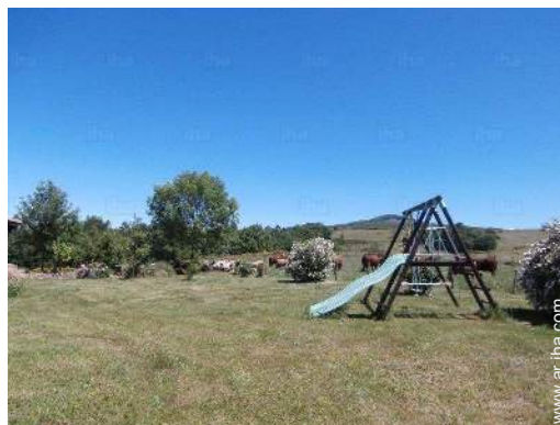
instalación de ocios