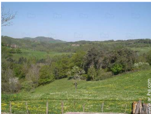
vista desde el dormitorio