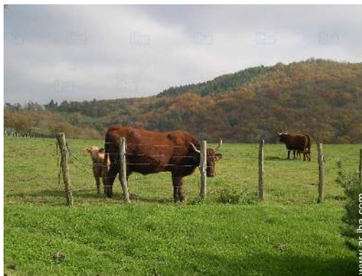
vista sobre el campo