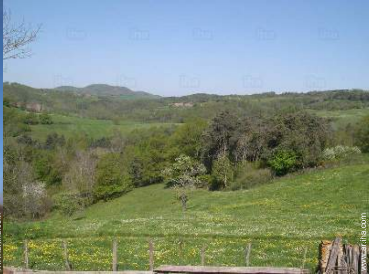
vista desde el dormitorio