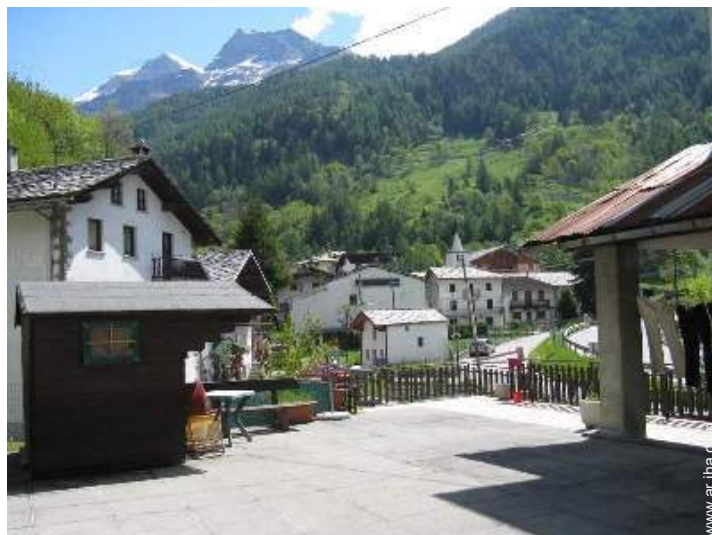
vista sobre el pueblo