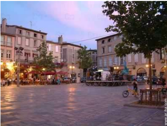
vista sobre el centro