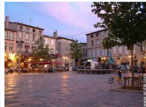
vista sobre el centro