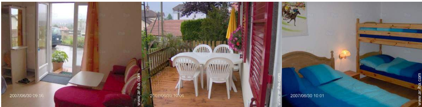
vista desde el cuarto de estar