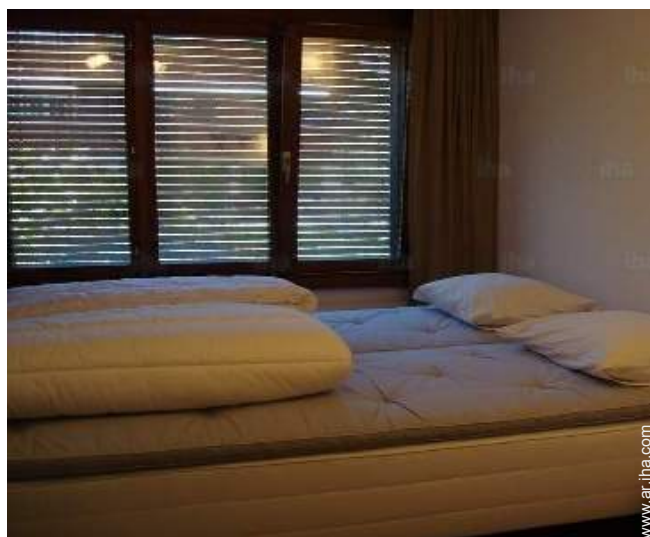
cuarto de invitados