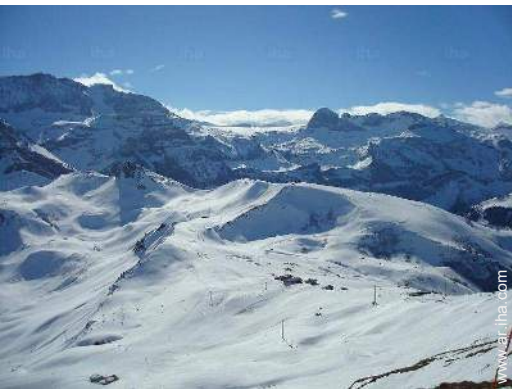
pistas de esquí