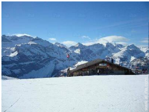
pistas de esquí