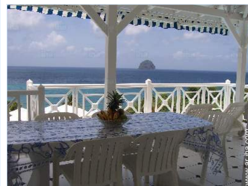
vista desde la terraza