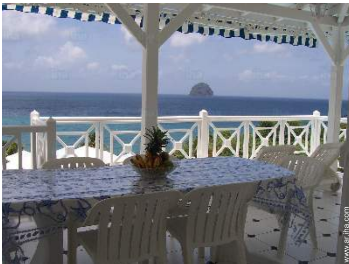
vista desde la terraza