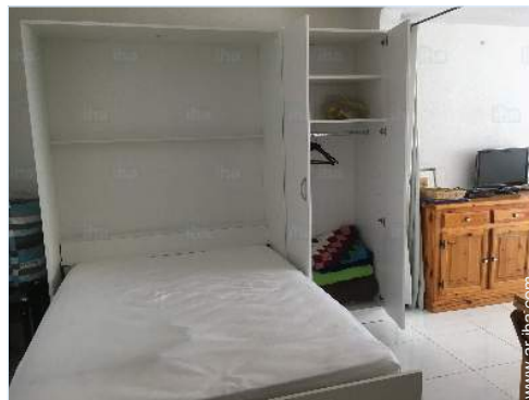
habitación del propietario