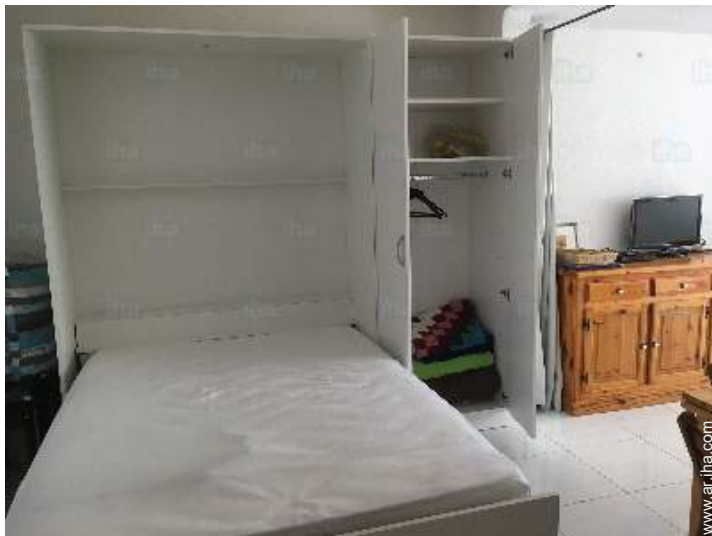
habitación del propietario