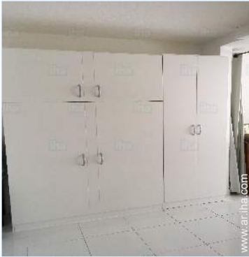
habitación del propietario