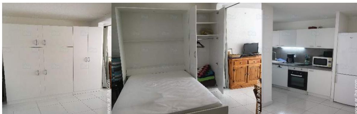
habitación del propietario