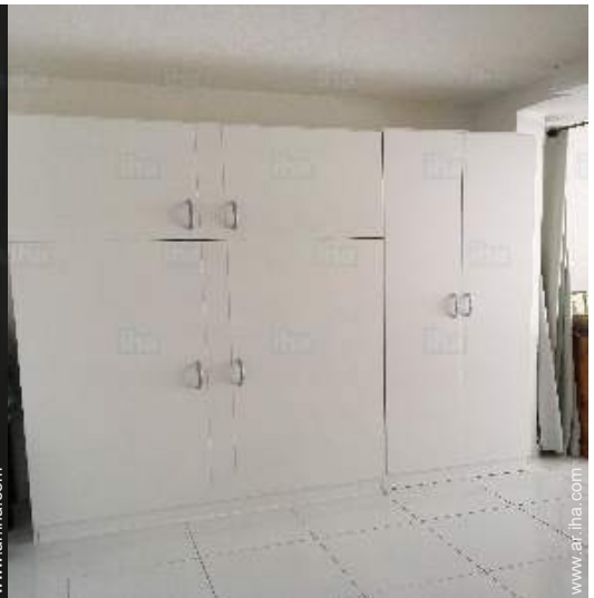
habitación del propietario