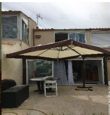
Instalaciones a disposición