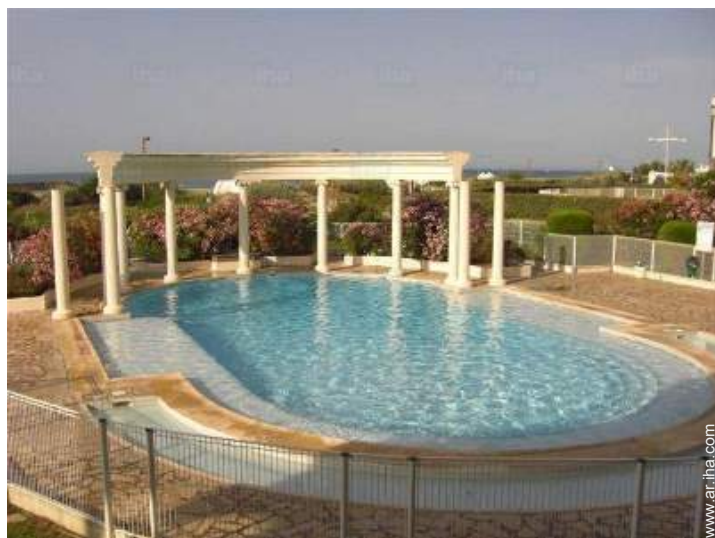
piscina en la residencia